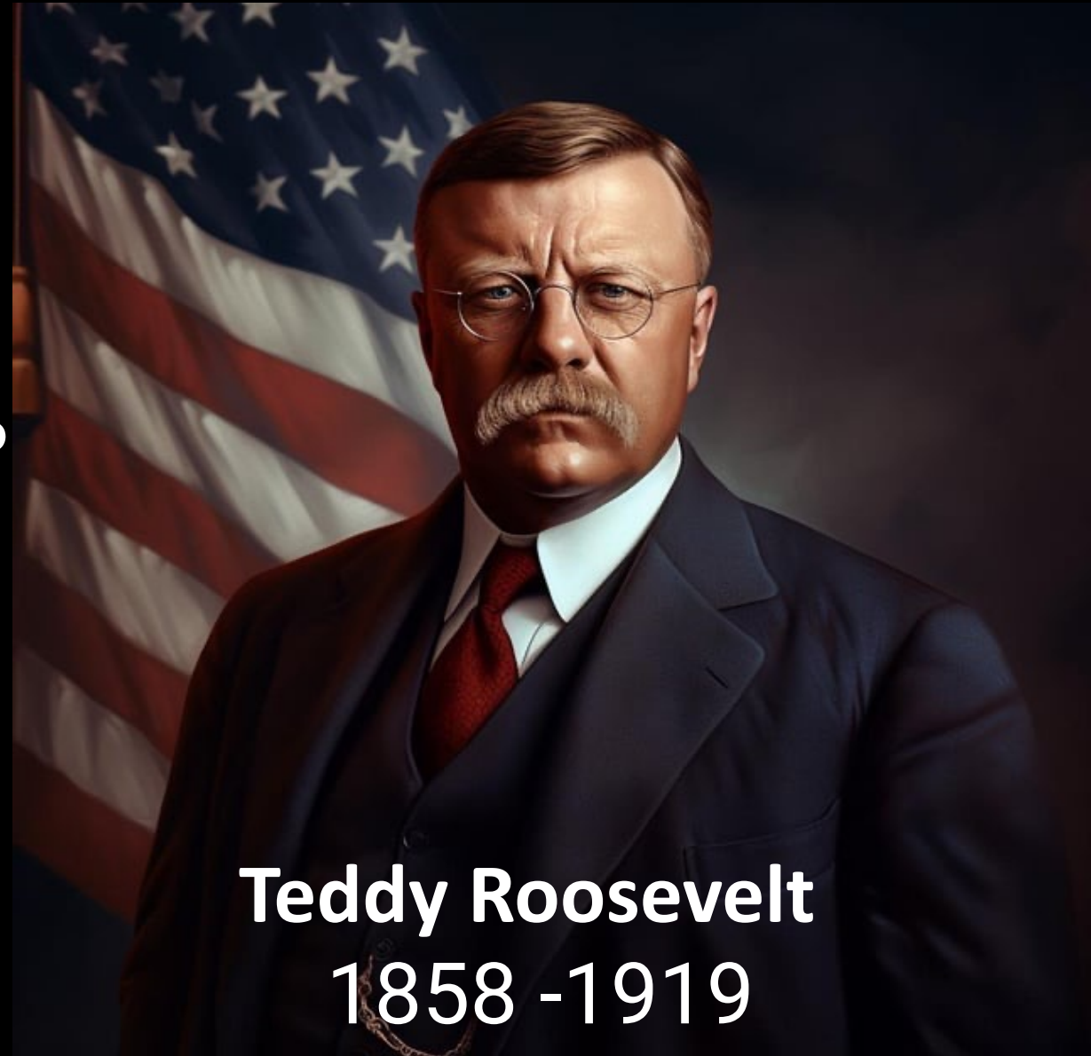
Teddy Roosevelt 1858 -1919

To educate a man in mind but not in morals is to educate a menace to society.