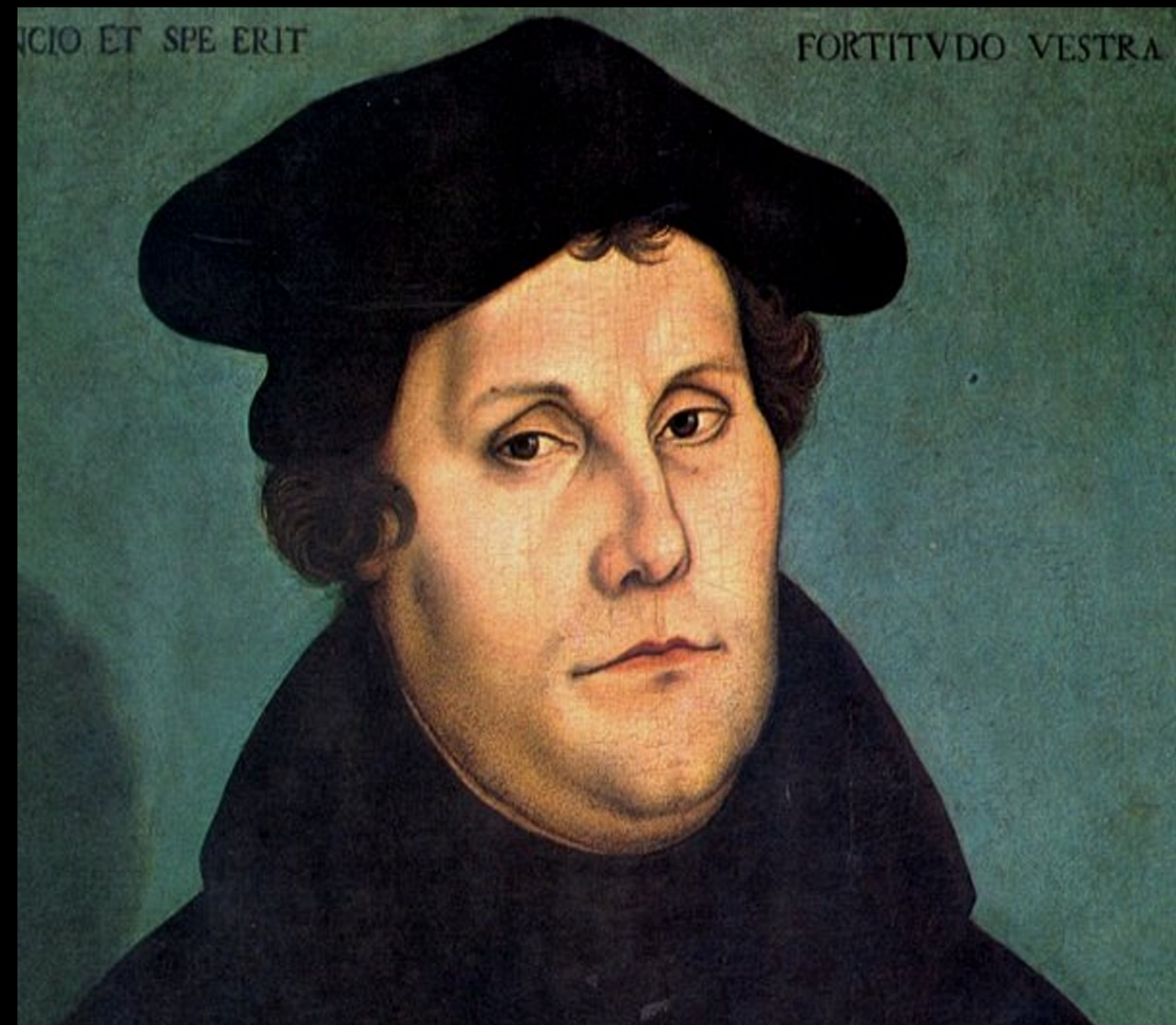
馬丁路德 Martin Luther

“我很擔心，除非學校努力闡釋聖經，並將其銘刻在年輕人的心中，否則學校將成為地獄之門。我建議任何人都不要把他的孩子放在不重視聖經的地方。”